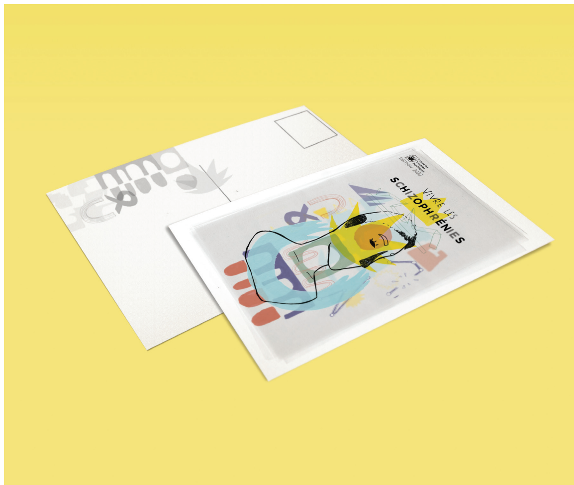
Carte postale A5 Impression numérique