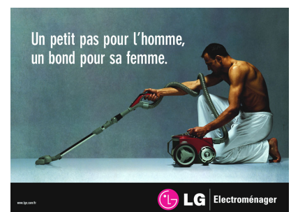
/En 2004, LG Electronics Inc s'est lancé dans la bataille pour la parité des tâches ménagères.