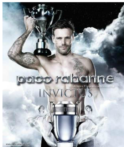
/Communication pour le parfum "Invictus" de Paco Rabanne.

/Francisco Bianchi "Les garçons bleus" "La série met en valeur la diversité des corps masculins et les histoires que ces personnalités singulières ont à raconter. Cela parle de nudité, de masculinité et de sexualité." le tout dessiné au stylo Bic bleu.