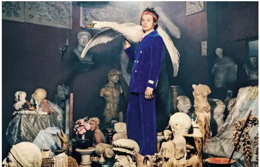
/Collection Gucci Tailoring Pre-Fall 2019 avec Harry Styles, portant les pièces rococo d'Alessandro Michele.